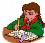
Dagbog skrives af: