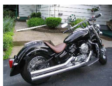
Alle informerer hinanden om priser på køretøjer