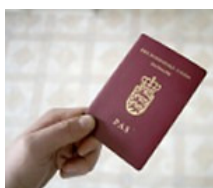
Husk Pas + Billetter

Vi mødes senest kl. 05.00 ved check-in i terminal 3. Husk at check-in også kan foretages hjemmefra.