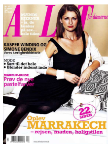
Ugeblade medtages af