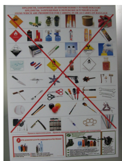
Ingen våben, knive, etc.